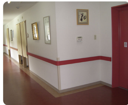
廊下・エレベーター乗降口