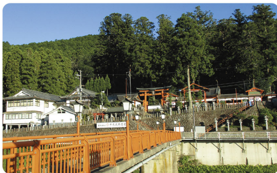
当ホームから見る墨坂神社